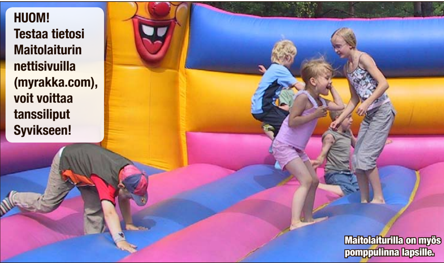
Maitolaiturilla on myös pomppulinna lapsille.

HUOM! Testaa tietosi Maitolaiturin nettisivuilla (myrakka.com), voit voittaa tanssiliput Syvikseen!